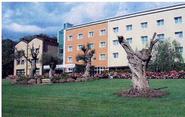
ANUSCA Palace Hotel