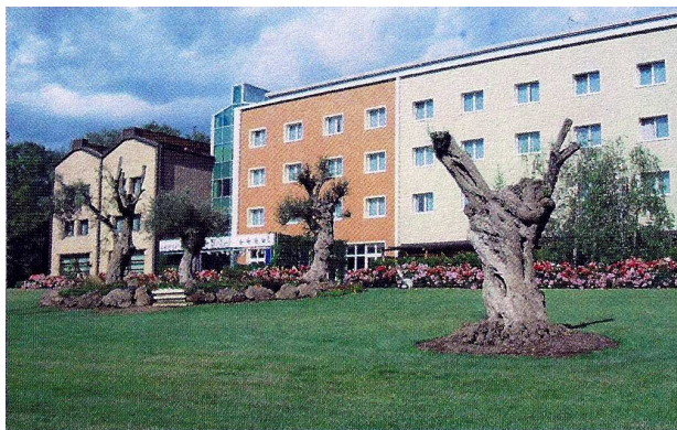
ANUSCA Palace Hotel